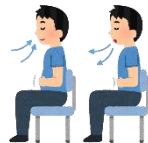
NHK健康チャンネル「自律神経のバランスをとってリラックス」